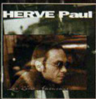
Les rêves américains CD Single : ref : 133021 WM 307